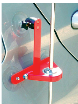
Tuyau avec double fixation magnétique (RM) Tuyau avec fixation 3 ventouses (RS)