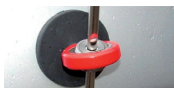
Tuyau avec fixation magnétique (RM)